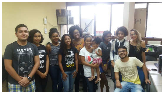
Figura 2. Minicurso com o PET Comunidades Populares.

Na segunda edição, o interesse demonstrado pela equipe do PET de Comunidades Populares, vide a Figura 2. Verificou-se que eles possuíam um verdadeiro desejo em aprender. Posteriormente, confirmamos o afincado colocado na criação do seu site ao sermos ocasionalmente consultados. A interação fora bastante expansiva e o aprendizado, de fato, satisfatório para o trabalho realizado em uma manhã.