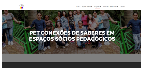
Figura 3. WebPage do PET Conexões Espaços Sócio Pedagógicos.

Vale ressaltar que o minicurso vem apresentando um grande feedback, já que ambos os sites desenvolvidos nas duas edições estão no ar e prontamente integrados com a WebPage principal do PET UFMA. Os sites podem ser visualizados nas Figuras 3 e 4.